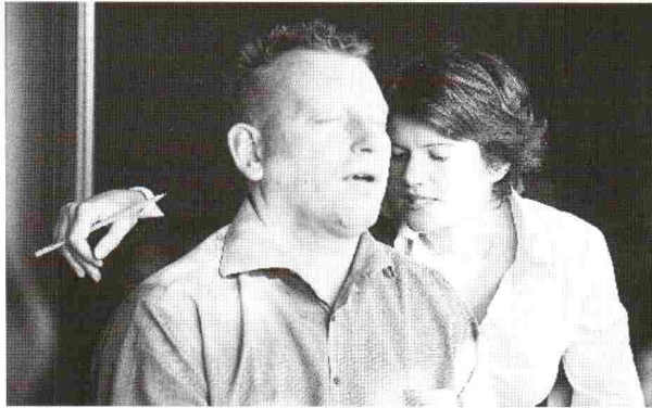
Die Aufladung (Doppeln), Foto von Ingrid Ebert, active english training

Wenn die Person das Gefühl hat, genug erzählt zu haben, werden die Stühle umgestellt. Die Erzählende sitzt vor mir, ich direkt links hinter ihr (in klassischer Doppler-Stellung).