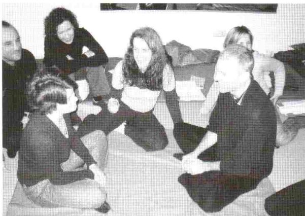
Eine Begegnung nach der Aufladung, Foto von Bernard Dufeu

Diese Aufladungs-Sequenz mache ich meistens zweimal, da ich beim ersten Mal wahrnehme, was die Person sprachlich und inhaltlich übernommen hat. Ich will stets mein Angebot an die Person anpassen.